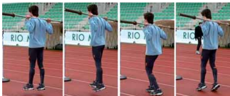
Figura 3 – Saltitares com barra (no lugar – com e sem troca de apoio)

A evolução da carga de trabalho será progressiva conforme a tabela número 2: