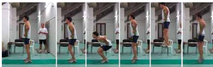
Figura 4 – Sequência fotográfica do Teste CMJ