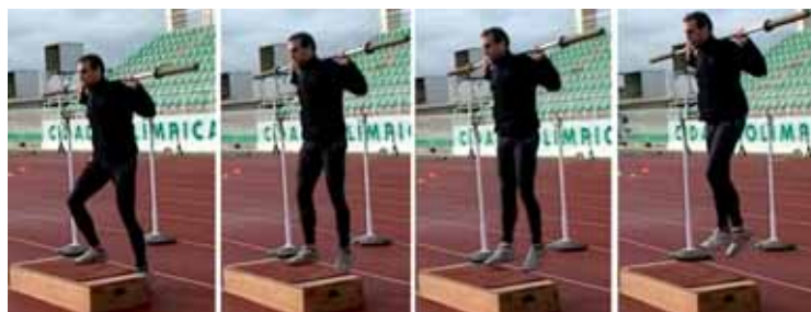
Figura 2 – Step – up com salto alternado e barra